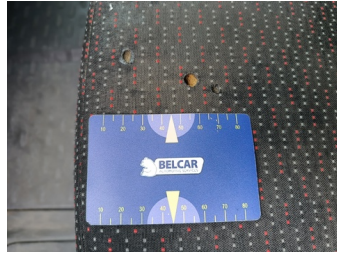
Reiniging - Reinigen - Vlek - Reinigen