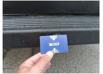
Koffer - Laaddeur RA - Kras en Deuk - Herstellen en spuiten