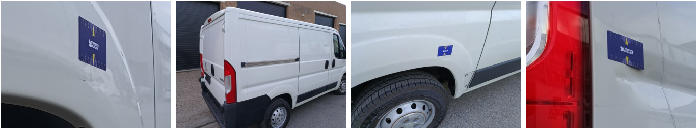
Vleugel RA - Sierlijst RA - Ontbreekt - Vervangen