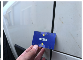
Vleugel LA - Vleugel LA - Kras en Deuk - Herstellen en spuiten