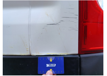
Licht LA - Licht LA - Kras - Vervangen