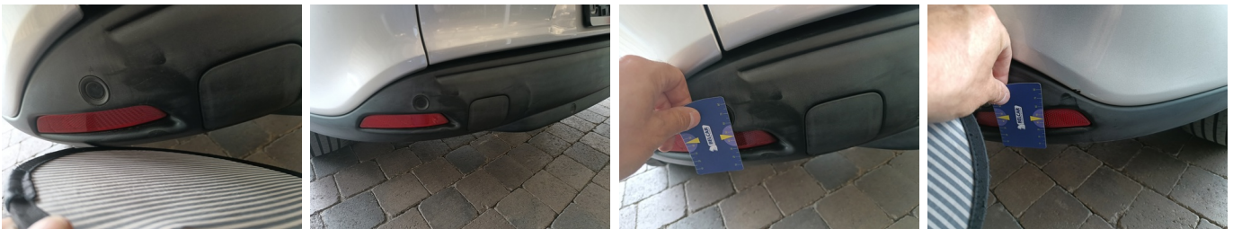
Bumper Achter - Bumper achter - Kras en Deuk - Herstellen en spuiten