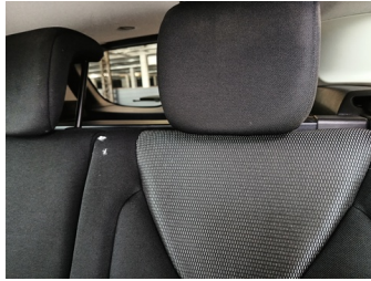
Zetels - Bekleding zit LV - Gat - Vervangen