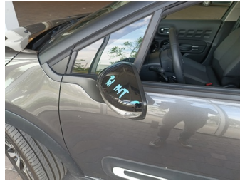
Deur LV - Deur LV - Kras - Spotrepair